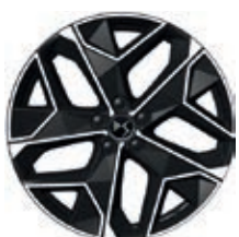
Hliníková kola 19" LIMA