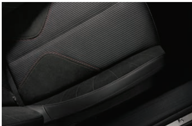
Kombinované textilní čalounění s Alcantarou® PERFORMANCE LINE