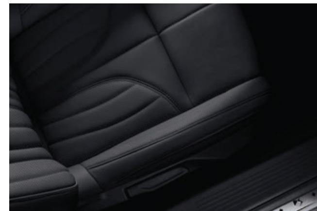
Tlačená černá kůže Basalte