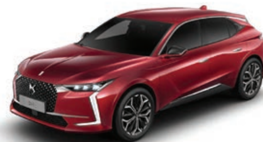
Červená Velvet (M) MOPQ

Černá střecha Perla Nera není k dispozici pro provedení CROSS. (M) : Metalická barva – (P) : Perleťová barva