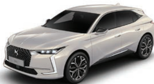
Bílá Cristal Pearl (M) MOPH