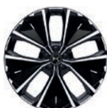
Hliníková kola 20" SYDNEY