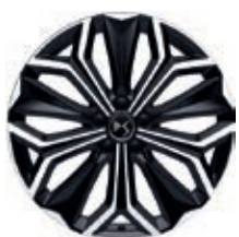
Hliníková kola 19" SEVILLA