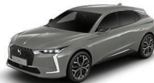
Šedá Lacquered (M) MOSC