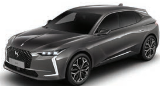
Šedá Platinum (M) MOVL