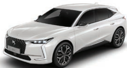
Bílá Nacré (P) M6N9