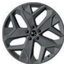
Hliníková kola 19" SAPPORO