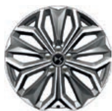
Hliníková kola 19" FIRENZE