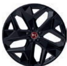
Hliníková kola 19" MINNEAPOLIS