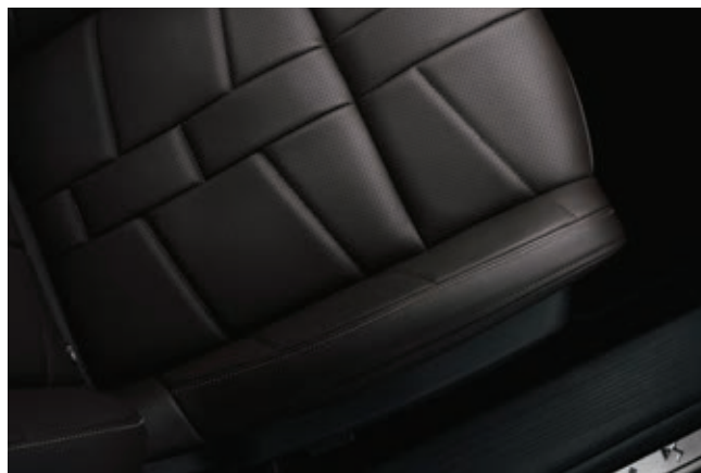
Hnědá kůže Criollo v provedení Bracelet