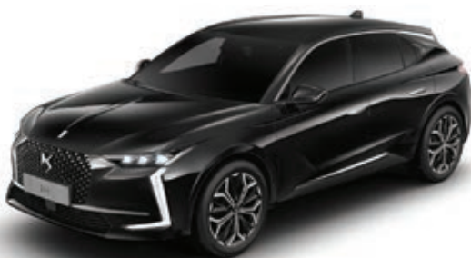
Černá Perla Nera (M) M09V