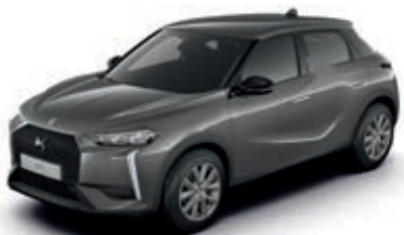
Šedá PLATINIUM (M)