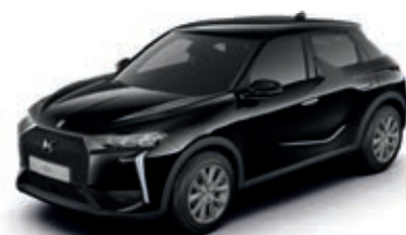
Černá PERLA NERA (M)