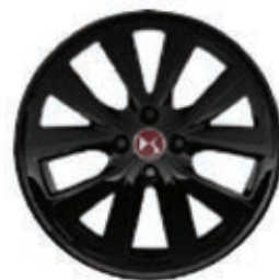
Hliníková kola 17" OSLO