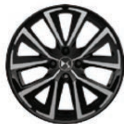
Hliníková kola 17" DUBLIN