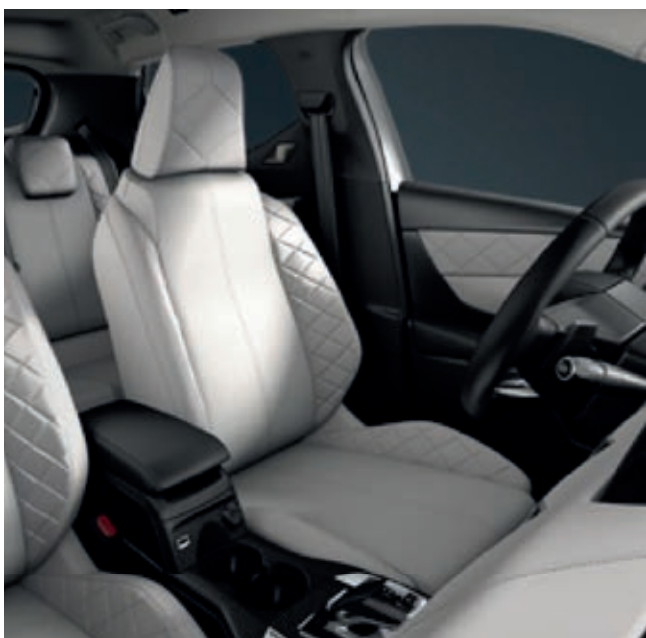
Interiér TROCADERO, světlé polokožené čalounění, látka Luxembourg s kůží Nappa šedá Galet