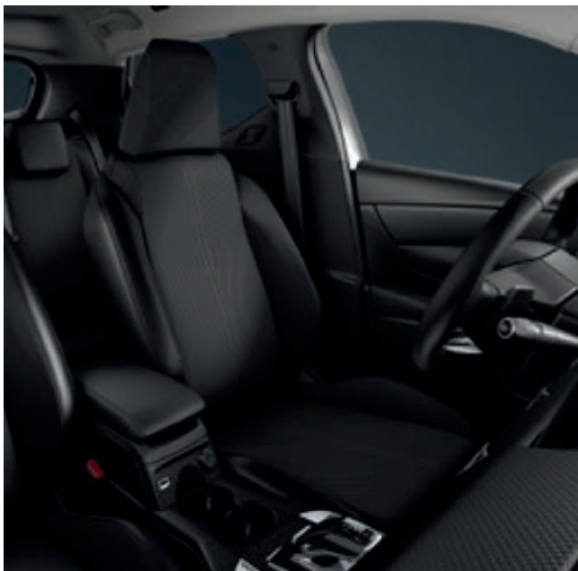
Interiér BASTILLE, čalounění sedadel látka Perruzi Silicium