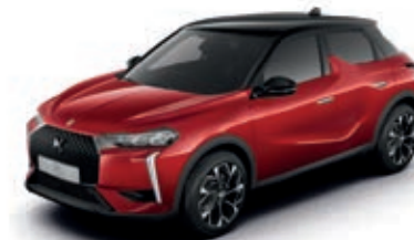
Červená Perleť DIVA (P)