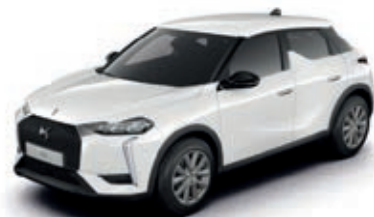
Bílá BANQUISE (N)