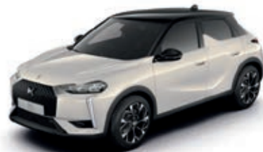
Bílá CRISTAL PEARL (M)