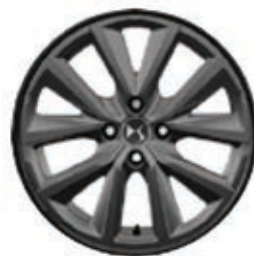
Hliníková kola 17" GLASGOW