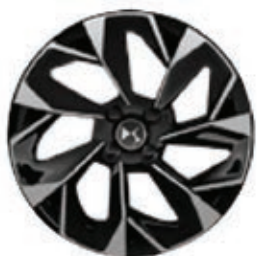
Hliníková kola 18" NICE