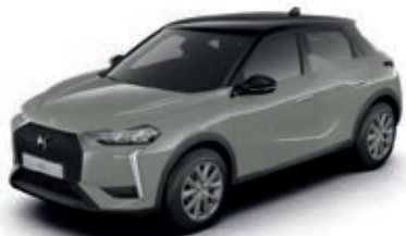
ŠEDÁ LACQUERED (M)