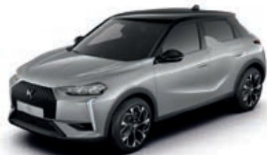
Šedá ARTENSE (M)