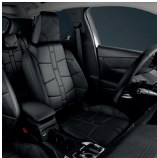
Interiér OPERA, kůže Nappa černá Basalte