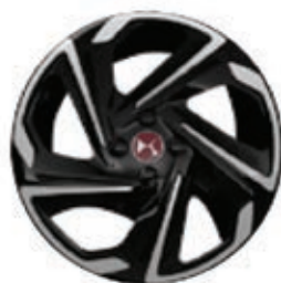
Hliníková kola 18" BOSTON