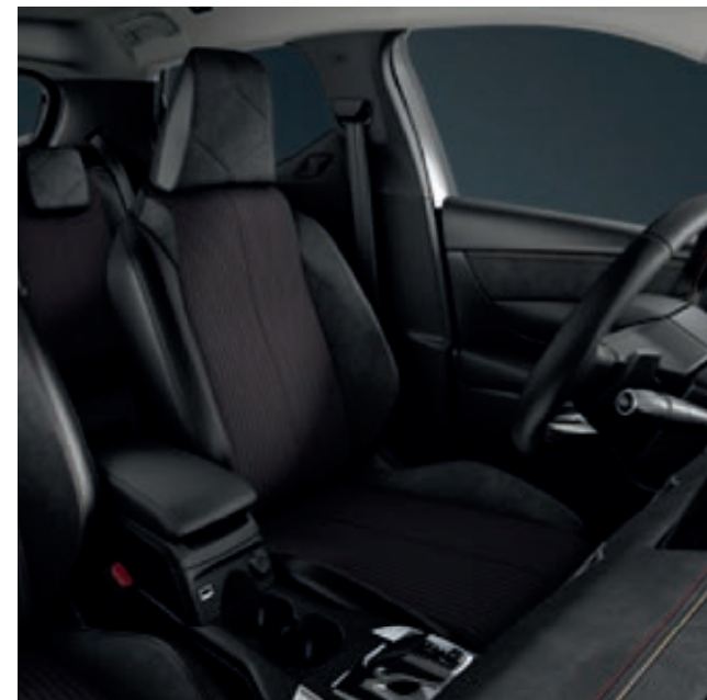
Interiér PERFORMANCE LINE, čalounění sedadel látka + Alcantara