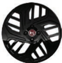
Hliníková kola 18" TOULOUSE