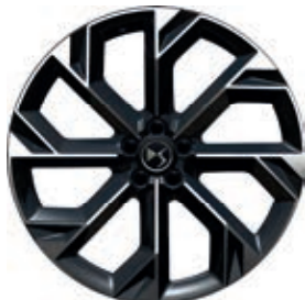
Hliníkový disk 21" BROOKLYN