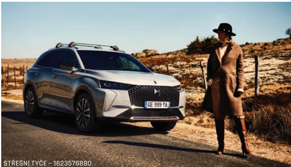
STŘEŠNÍ TYČE – 1623576880