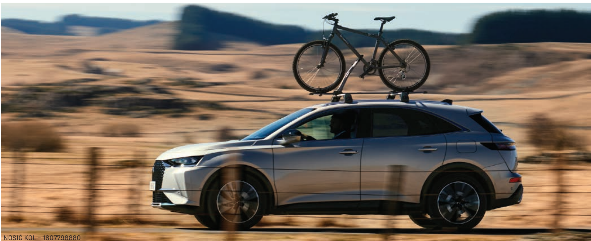
NOSIČ KOL – 1607798880