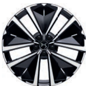
Hliníkový disk 19" EDINBURGH