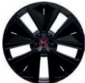
Hliníkový disk 19" SILVERSTONE