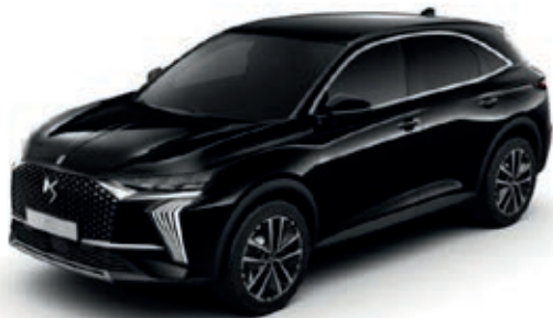
Černá PERLA NERA (M)