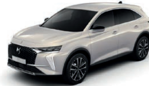
Bílá CRISTAL PEARL (M)