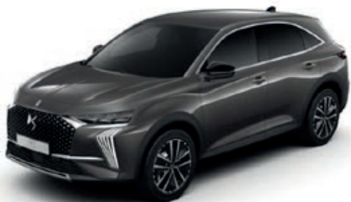
Šedá PLATINIUM (M)