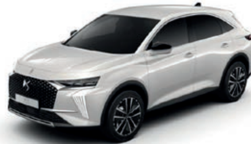
Bílá PERLE (P)