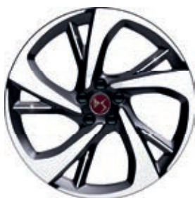
Hliníkový disk 20" TOKYO (pro Performance Line +)