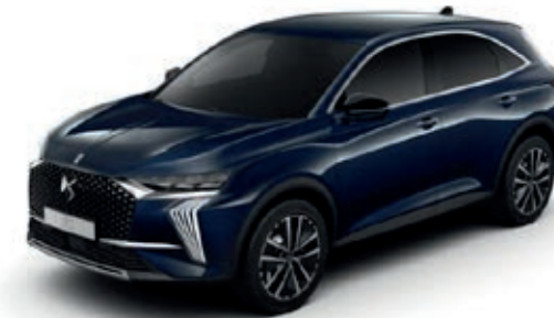
Modrá SAPHIR (M)