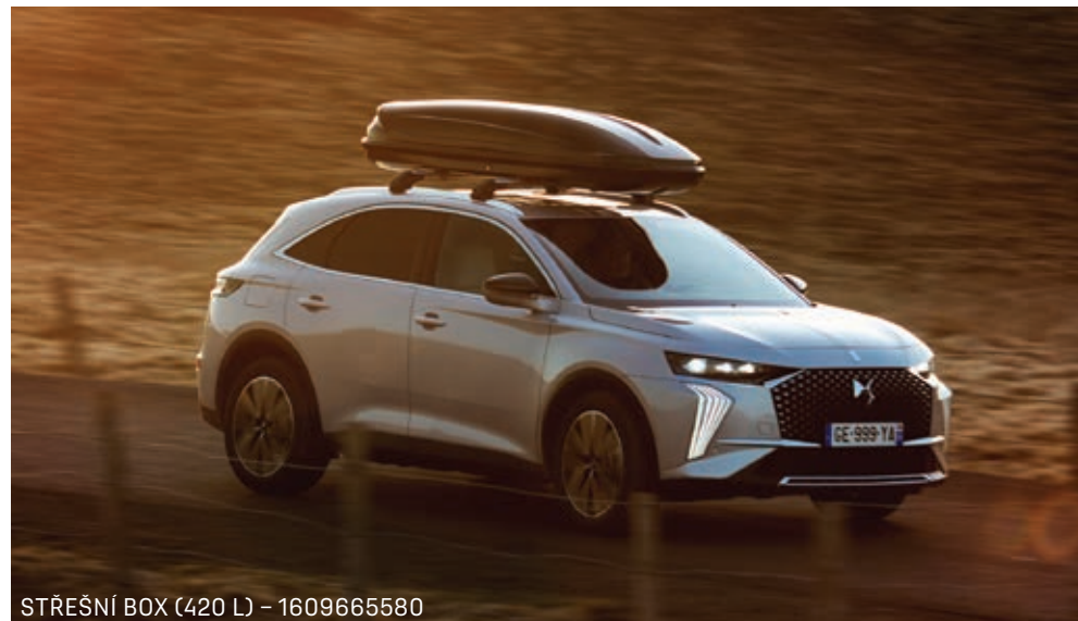
STŘEŠNÍ BOX (420 L) – 1609665580