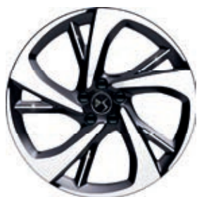
Hliníkový disk 20" TOKYO