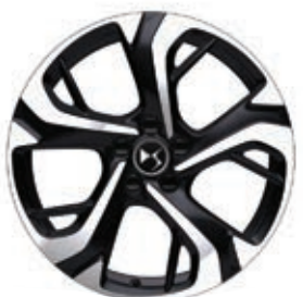
Hliníkový disk 18" VIENNA

Je elektronicky řízené odpružení se třemi módy: Sport / Normal / Comfort. V módu Comfort kamera umístěná pod čelním sklem analyzuje silnici před vozem v rozsahu 5 – 20 m, další senzory monitorují pohyby a parametry vozu. Na základě takto získaných údajů elektronika s předstihem upravuje průtok oleje v tlumičích, aby zajistila co možná nejhladší průjezd přes nerovnosti. Mód Comfort Camera je funkční v rychlostech cca 15 – 130 km/h, nefunguje ve tmě nebo při snížené viditelnosti (husté sněžení a podobně). Při nastartování vozu je odpružení automaticky vždy v módu Normal.