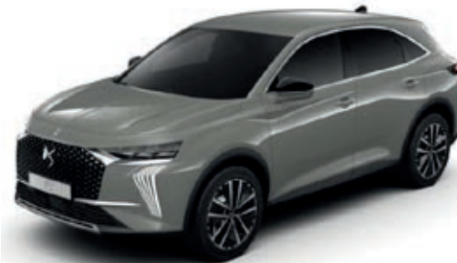
Šedá LACQUERED (M)